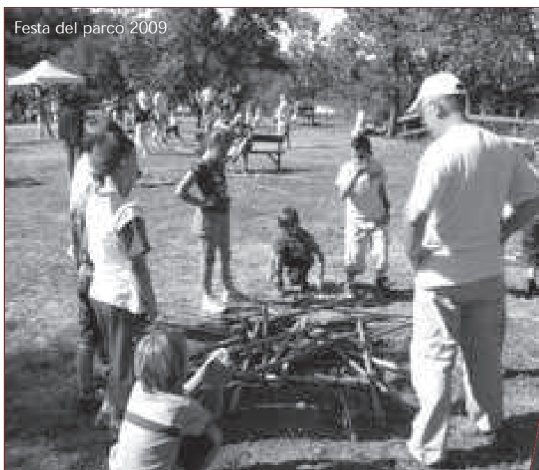
Festa del parco 2009