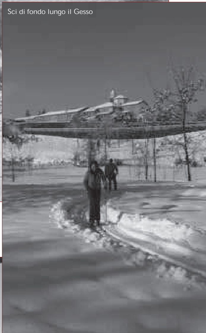
Sci di fondo lungo il Gesso