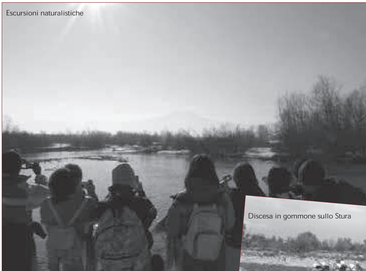
Discesa in gommone sullo Stura